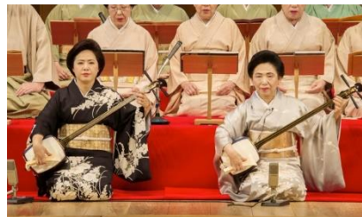
端唄 華房流 華の会