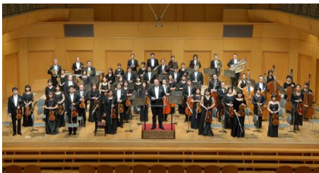
セントラル愛知交響楽団

その中から今回はANET（愛知芸術文化協会）に所属している団体で、名古屋を中心に活動の場を広げている セントラル愛知交響楽団 と 端唄 華房流 華の会 をピックアップ。12月の公演で「椿説曾根崎心中夢幻譚」でクラシックと邦楽のコラボレーションを果たす2団体について、当館で収集した資料と、2団体からの提供資料を文化のみち二葉館展示室と名古屋市芸術創造センターロビーにて展示し、その足跡をたどります。