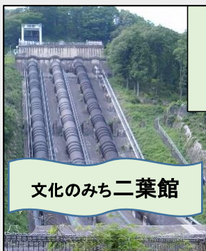
文化のみち二葉館