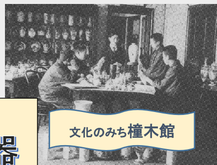
文化のみち榎木館