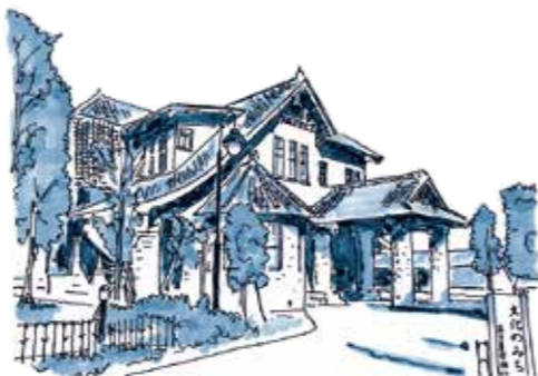
文化のみち二葉館

1985年に「白壁・主税・榎木町並み保存地区」に指定されたこのエリアで、点在する近代建築資産を活用して、週末になると職人の技を学ぶ「手の知」や古い建築の価値を学ぶ「レトロ建築」などの講座を企画・