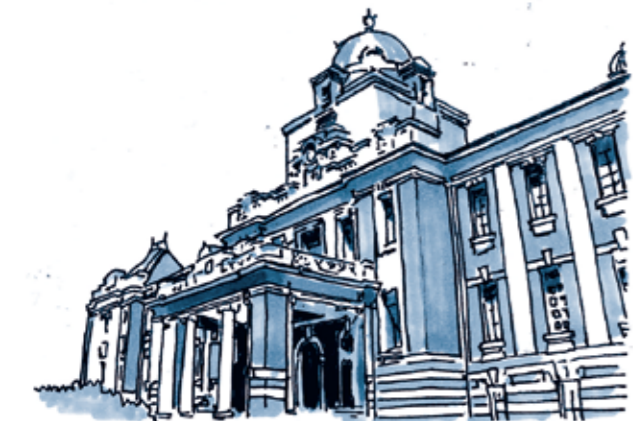
名古屋市市政資料館

その後、地区内に更なる環境問題が発生しました。住環境を守るために2008年「白壁・主税・榎木まちづくり提案」が町内会を中心になされ、その活動にも白壁アカデミアは深く関わりました。その内容は2012年から名古屋市都市景観形成地区に反映されています。